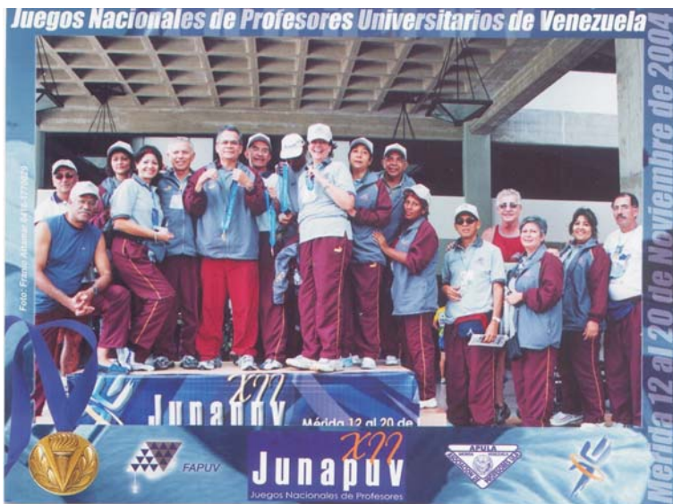
Delegación de la APUC que participó en la disciplina "caminata".

Resaltó de manera especial su actuación en dominó, disciplina en la cual los representantes de la APUC fueron nombrados campeones, buraco - donde lograron la segunda posición -; así como en bolas criollas, boliche, natación, caminata, billar y tenis de campo, en los que consiguieron un tercer lugar.