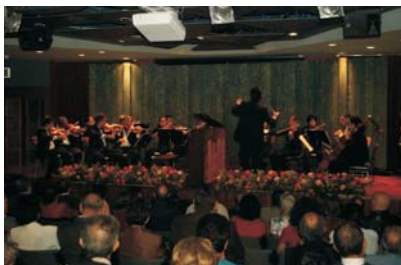
Orquesta de Cámara de la UC.

Posteriormente, los invitados especiales, pasaron a compartir un agradable brindis en el que rememoraron las más divertidas anécdotas de su "época dorada".