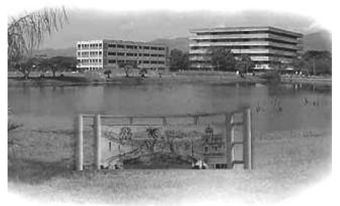
UNIVERSIDAD DE CARABOBO.

Nota 2: Artículo 19: "Si transcurrida una hora después de la fijada para la instalación de la Asamblea General, no se ha logrado el porcentaje requerido en el anterior, ésta se instalará con los miembros presentes cualesquiera sea su número, siempre y cuando existan miembros distintos a los de la Junta Directiva. Una vez instalada la asamblea, se requerirá la mitad más uno de los miembros presentes para la toma de cualquier decisión y las mismas será de obligatorio cumplimiento para todos los miembros."