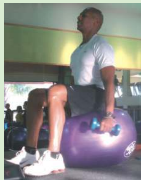
En las clases se puede notar fácilmente la asidua asistencia de personas de la tercera edad ...

“Apoyamos la posición autonómica del Consejo Universitario en defensa de los mecanismos de admisión a las universidades”.