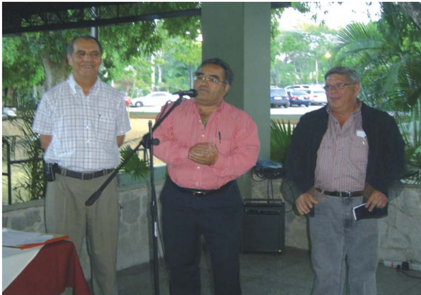
(REDACCIÓN).- La sede del Polígono de tiros del Estado Carabobo fue el escenario donde se reunieron los profesores jubilados de la Universidad de Carabobo, para celebrar y recibir un reconocimiento público como integrantes de la delegación que representó a nuestra universidad en los III Enapujujev, realizados en el mes de noviembre de 2007 en la ciudad de Barquisimeto. P/10