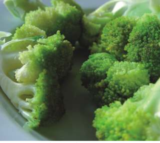
Crema de Brócoli (para 4 personas)

En adelante, tendremos que ver con nuevos ojos este maravilloso alimento. Es conveniente adquirirlo, cuando sus flores poseen un color verde intenso, porque eso habla de su calidad y frescura. Podemos consumirlo en forma de crema, haciendo las veces de una entrada, o como mousse, gratén, ensalada, salteado, por sólo mencionar algunas de sus múltiples variantes. Intentaremos dar en esta ocasión varias recetas.