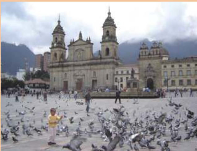
La Plaza de Bolívar en el centro de Bogotá

Se trata de un periplo de dos semanas por el eje occidental colombiano, donde entre otras cosas, conoceremos interesantes museos, la zona histórica y los sitios de interés de la capital neogranadina, la industria del café, la moderna infraestructura civil de sus ciudades, costumbres, tradiciones, gastronomía, y sobre todo, la hospitalidad de su gente.